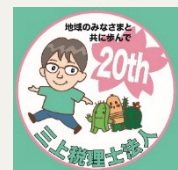
【今年のTシャツデザイン画。 可愛いですね】

さて、2025年度の労働関係の法令改正のなかで目玉となるのが、育児・介護休業法の改正です。同法は少子化対策の主要施策であることから頻りに改正されており、今回は4月と10月に2段階で改正されます。来月号にて詳しく内容を紹介していきます。