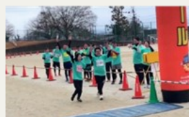
【最後の走者がゴールした時には 拍手喝采！サライが聴こえます(笑)】