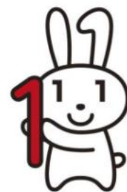
愛称 「マイナちゃん」