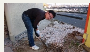
【カメラ目線はいいりませんよ！代表】

さて、今シーズンも欠かさず観ていた「ドクターX」が終わり大門口ス中ですが（笑）…事務所には口ス中がもう一人。「私、失敗しないので」を乱用（笑）していましたが、インター店建物周辺の雑草対策に砂利を敷こうとしたところ…「足りないじゃん💩」。購入した砂利が全く足らず。あれ？代表、失敗しないんじゃないやありませんでしたか？「いや～一年計画で敷いてくよ～」と言う代表の額には汗が光っていました☆彡