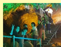
【↑事務所若手のメンバー達】

1 日目は、前日の台風の影響にて、飛行機が 2 時間遅れでの出発となりました。到着後昼飯、のち鍾乳洞へ散策しました。