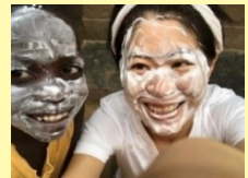
【バースデーケーキの生クリームまみれ(笑)】

「旅行？」いいえ、子ども達に会いにです。きっかけは、ウガンダへ観光した際に道端で暮らしていたほんの4~5歳ほどのストリートチルドレンを目の当たりにしたことが始まりです。大人の保護や愛情が必要な年齢の子どもたちが、自力で路上で暮らしています。そんな子どもの助けになりたいという思いからウガンダ通いが始まりました。