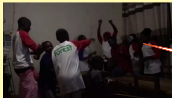
【ウガンダで流行っている Boasty♪ 私がリズムに乗ろうとすると事務所で爆笑されました】

現在は、日本、欧米がサポートするウガンダ人自身で運営する「SAVO」にて、子ども達が自立できるよう、教育を受けられるサポートからありとあらゆる経験が出来る機会作りを行っています。今では、ボランティア活動というよりライフスタイルの一部になっており、ウガンダへ帰る(・・)(笑) ことにより英気を養っております(^_-)-☆ 興味を持った方はご連絡ください♪