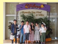
【↑ホテルの出口での写真】